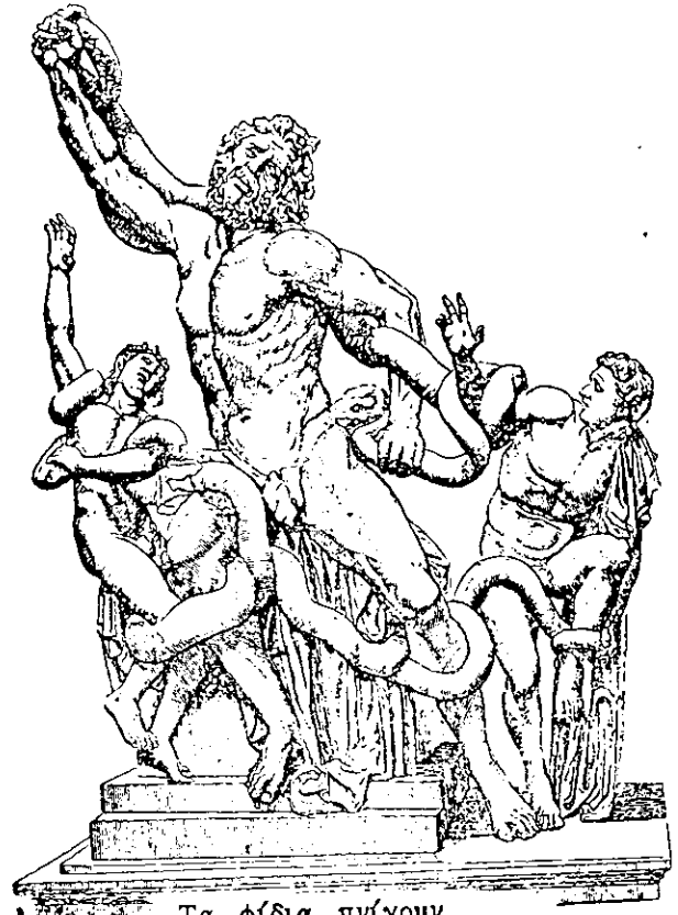
Τα φίδια πνίγουν τον Λαοκρόντα και τους δυο γιούς του

Πολλοί είπαν πώς, αφού το άλογο είναι αφιερωμένο στους θεούς, πρέπει να το φέρουν μέσα στην πόλη. Και αφού είναι ψηλότερο από τα τείχη, πρέπει να χαλάσουν ένα μέρος, για να μπει το άλογο μέσα.